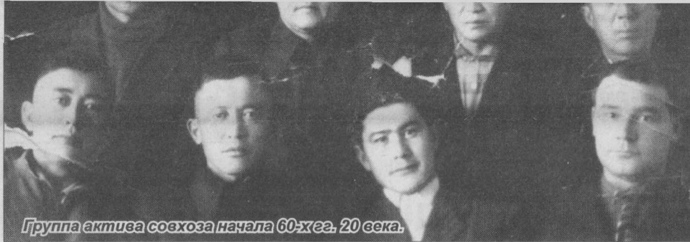
Группа актива совхоза начала 60-х гг. 20 века.