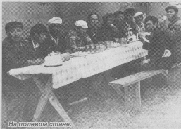
На полевом стане.